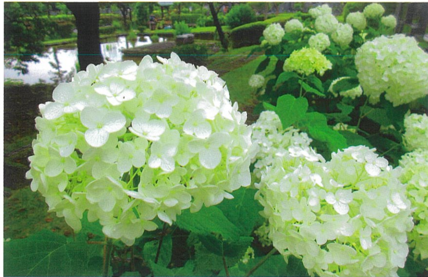
見頃を迎えたアジサイアナベル

墓地と公園の2つの機能を併せ持つ「みどりが丘公園」。お墓参りはもちろんのこと、散歩やジョギング、自然観察にも人気のスポットです。四季折々に美しい景色を眺めながら、ゆったり心なごむ時間をお過ごしください。