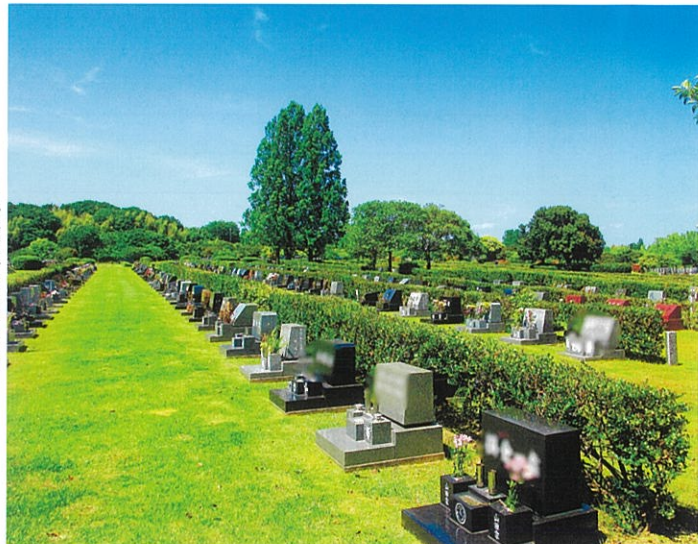
一般墓地(芝生墓地)

令和8年度一般墓地(普通墓地・芝生墓地・修景墓地)の使用者を募集します。受付初日の4月19日(日)は、名古屋市内にお住まいの方を対象に、抽選会を開催します。翌日4月20日(月)から翌年3月6日(土)までの募集期間は、名古屋市以外にお住まいの方も申込可能で、随時申込受付いたします。詳細は、当園事務所や区役所等に配架中の募集案内をご確認ください。