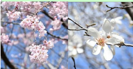
サクラ(コシノヒガン)