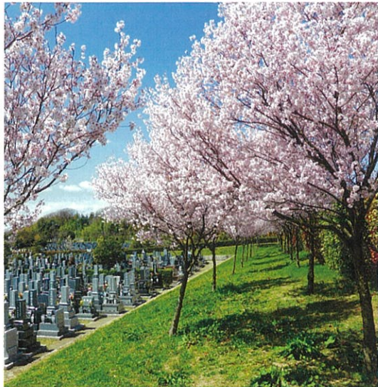
見ごろを迎えたコヒガンザクラ

墓地と公園の2つの機能を併せ持つ「みどりが丘公園」。お墓参りはもちろんのこと、散歩やジョギング、自然観察にも人気のスポットです。四季折々に美しい景色を眺めながら、ゆったり心なごむ時間をお過ごしください。