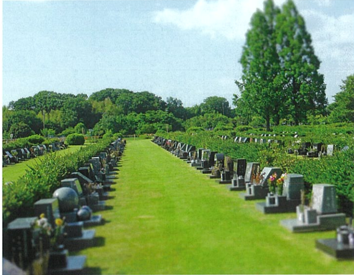
一般墓地(芝生墓地)

お墓を継ぐ人がいない方や、子供にお墓の管理等の負担をかけたくない方、終活等で生前に申込みたい方などに適しています。募集期間は5月10日(金)から翌年3月6日(木)まで、名古屋市在住で焼骨を含む申込の方、名古屋市在住で生前申込の方、名古屋市外在住の方、それぞれ受付開始日が異なりますのでご注意ください。詳細は当園事務所や区役所等に配架中の合葬式墓地募集案内書を、ご確認ください。