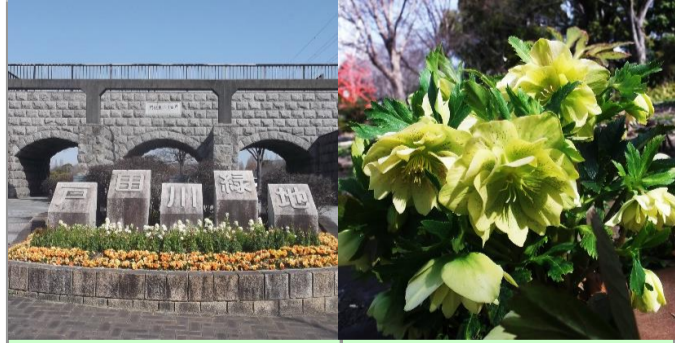
パンジー、ストック等