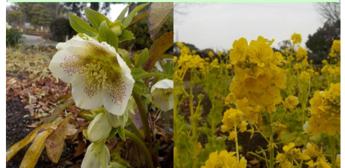
クリスマスローズ