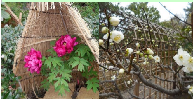
フユボタン (葉囲い)