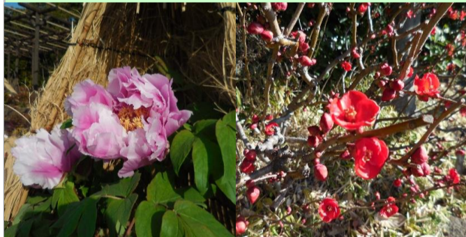
フユボタン(葉囲い)