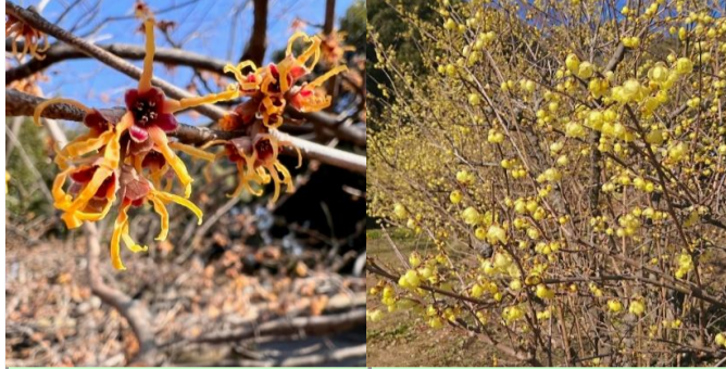
マンサク(咲き始め)