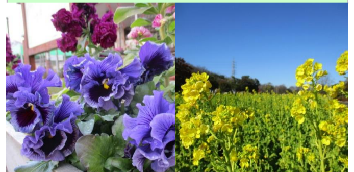
パンジー、ビオラ、ストック