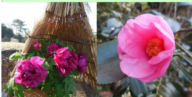
フユボタン(葉囲い)