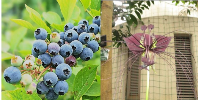
ブルーベリー 【ブルーベリー園】