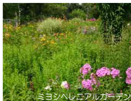
ミヨシペレニアルガーデン

で鳥や昆虫などたくさんの生き物が生息する環境ができ、生態系が整うことで植物も生き物も本来の姿で生育する美しい景観がつけられている萌木の村のナチュラルガーデンでした。