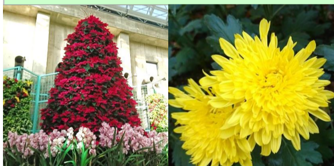
ポインセチアツリー