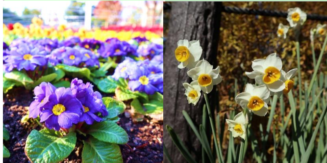
プリムラ・シクラメンなど